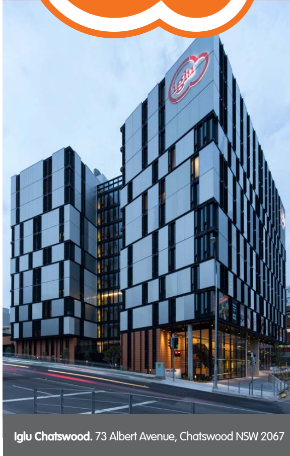
Iglu Chatswood. 73 Albert Avenue, Chatswood NSW 2067