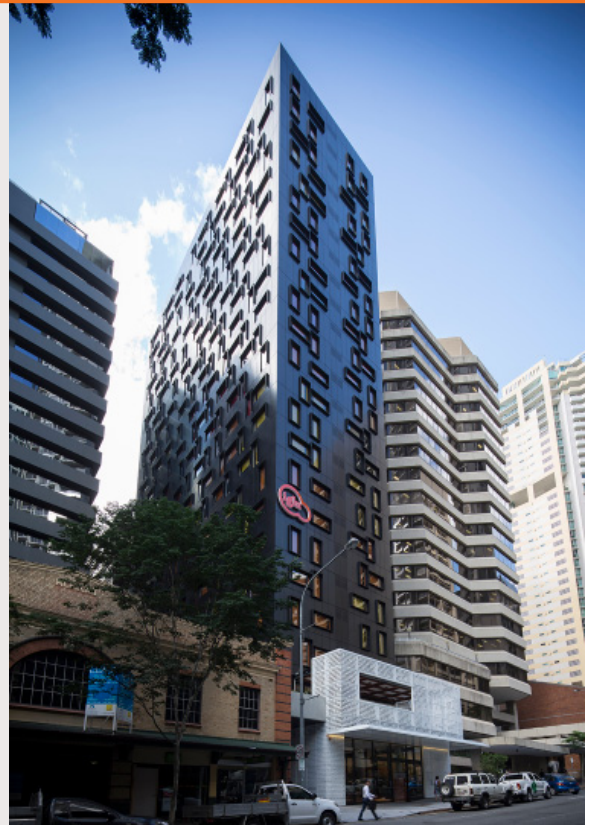
布里斯班市玛丽街65号Iglu(伊格鲁)布里斯班城，QLD 4000